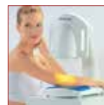
TRATTAMENTO DOLORI CON FOTOTERAPIA