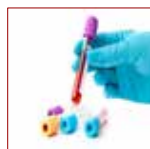
AUTOANALISI TEST INTOLLERANZE