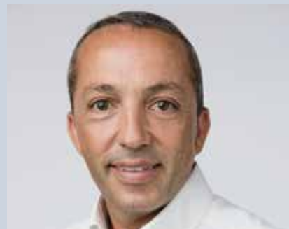
A cura del Dott. Loris Bonamassa