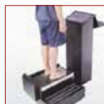
PODOLOGO ESAME POSTURA